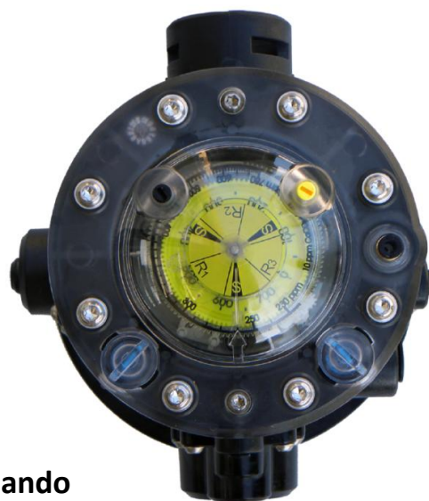
Vista dall'alto nuova testa di comando

Ancora più performante anche ad elevate durezza dell'acqua grazie al nuovo venturi potenziato. Per andare incontro alle richieste dei clienti più esigenti il colore della testa dell'addolcitore è stata cambiata in giallo vivo ben leggibile anche quando l'addolcitore viene installato in zone con scarsa presenza di luce. Inoltre è stato aggiunto un disco per la lettura ed il monitoraggio dei litri disponibili di acqua addolcita prima della successiva rigenerazione .